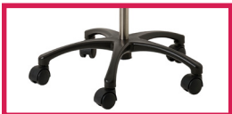
NEW Nouvelle base ABS design