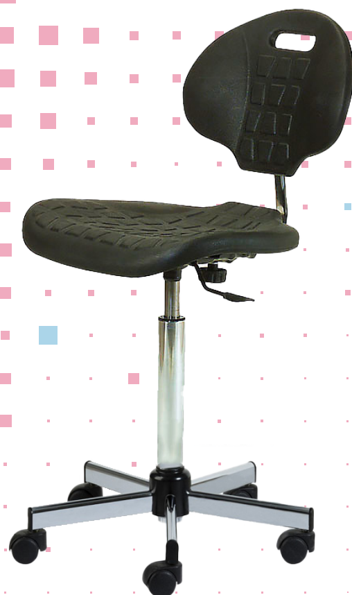
Photo du modèle avec pied chromé au lieu de pied aluminium