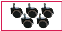
ACCROULETTE-03 5 roulettes double galet sol dur diam. 50mm