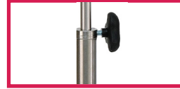
ACC 320BGS Bague de serrage inox